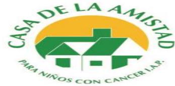
Casa de la Amistad para Niños con Cáncer, I.A.P.