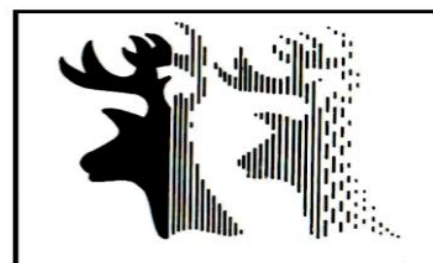
Asoc. Renal Venados, A.C.