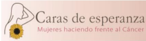
Caras de Esperanza, A.C.